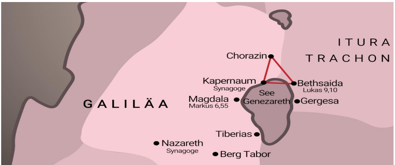
Die Evangelien berichten von 35 Wundern Jesu. 29 davon geschahen in dem kleinen Dreieck zwischen Kapernaum, Chorazim und Bethsaida.